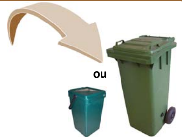
Epluchures - Restes de repas - Filtres à thé et café Peeling - Leftovers - Tea and coffee filters