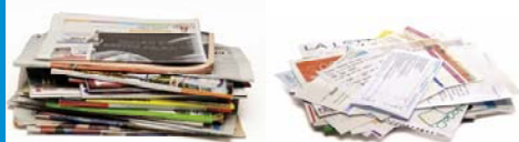
Papiers - Paper