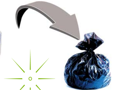
Sacs et films en plastique - Vaisselle jetable - Emballages et barquettes en plastique - Pots de yaourt - Polystyrène - Plastic film and bags - Disposable tableware - Packaging and plastic trays - Yoghurt - Polystyrene -