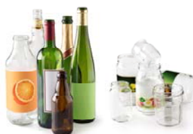
Bouteilles et pots en verre - Glass