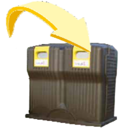
Emballages métalliques - Emballages en carton et briques - Bouteilles et flacons en plastique Metal packaging - Cardboard packaging and Tetrapacks - Plastic bottles