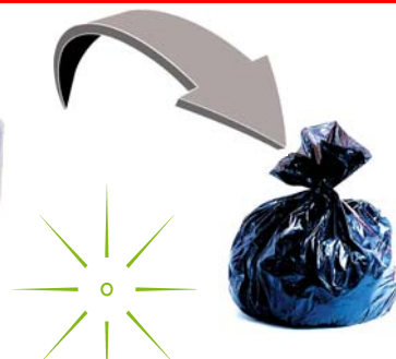
Sacs et films en plastique - Vaisselle jetable - Emballages et barquettes en plastique - Pots de yaourt - Polystyrène Plastic film and bags - Disposable tableware - Packaging and plastic trays - Yoghurt - Polystyrene -