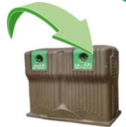
Bouteilles et pots en verre - Glass