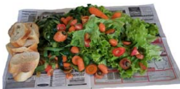
Epluchures - Restes de repas - Filtres à thé et café Peeling - Leftovers - Tea and coffee filters