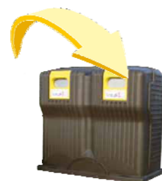
Emballages métalliques - Emballages en carton et briques - Bouteilles et flacons en plastique Metal packaging - Cardboard packaging and Tetrapacks - Plastic bottles