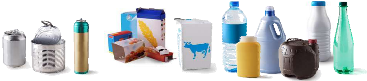
Emballages métalliques - Emballages en carton et briques - Bouteilles et flacons en plastique Metal packaging - Cardboard packaging and Tetrapacks - Plastic bottles