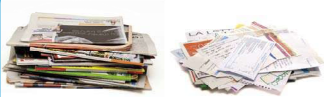
Papiers - Paper