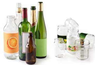
Bouteilles et pots en verre - Glass