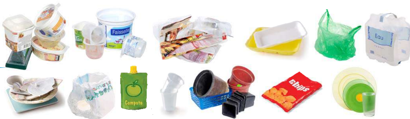
Sacs et films en plastique - Vaisselle jetable - Emballages et barquettes en plastique - Pots de yaourt - Polystyrène Plastic film and bags - Disposable tableware - Packaging and plastic trays - Yoghurt - Polystyrene