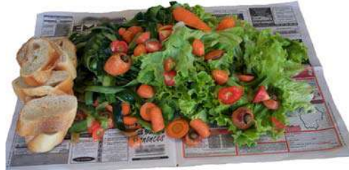
Epluchures - Restes de repas - Filtres à café et thé Peeling - Leftovers - Tea and coffee filters